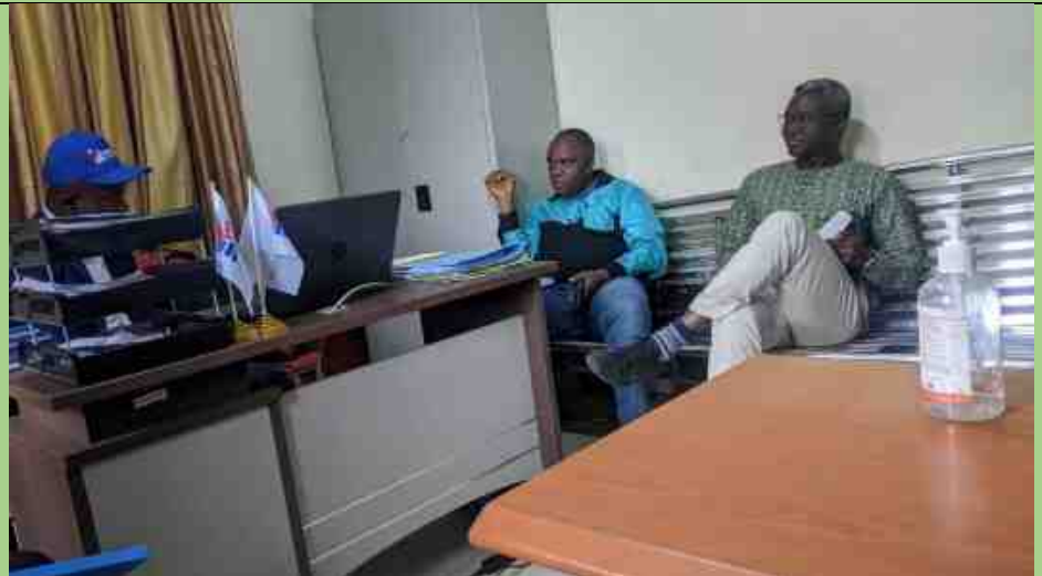
Echanges entre ladélégation de la DDC et le staff BCECOLOANS affecté au projet OSEP II