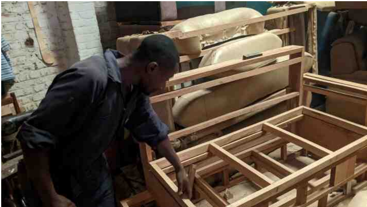
Photo de sensibilisation pour KALEHE