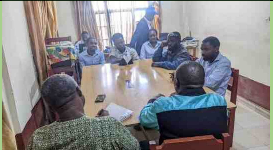
Entretiens de la délégation de la DDC avec les entrepreneurs bénéficiaires de OSEP I

Ils ont eu un petit moment d'échange avec les entrepreneurs bénéficiaires du projet OSEP 1.