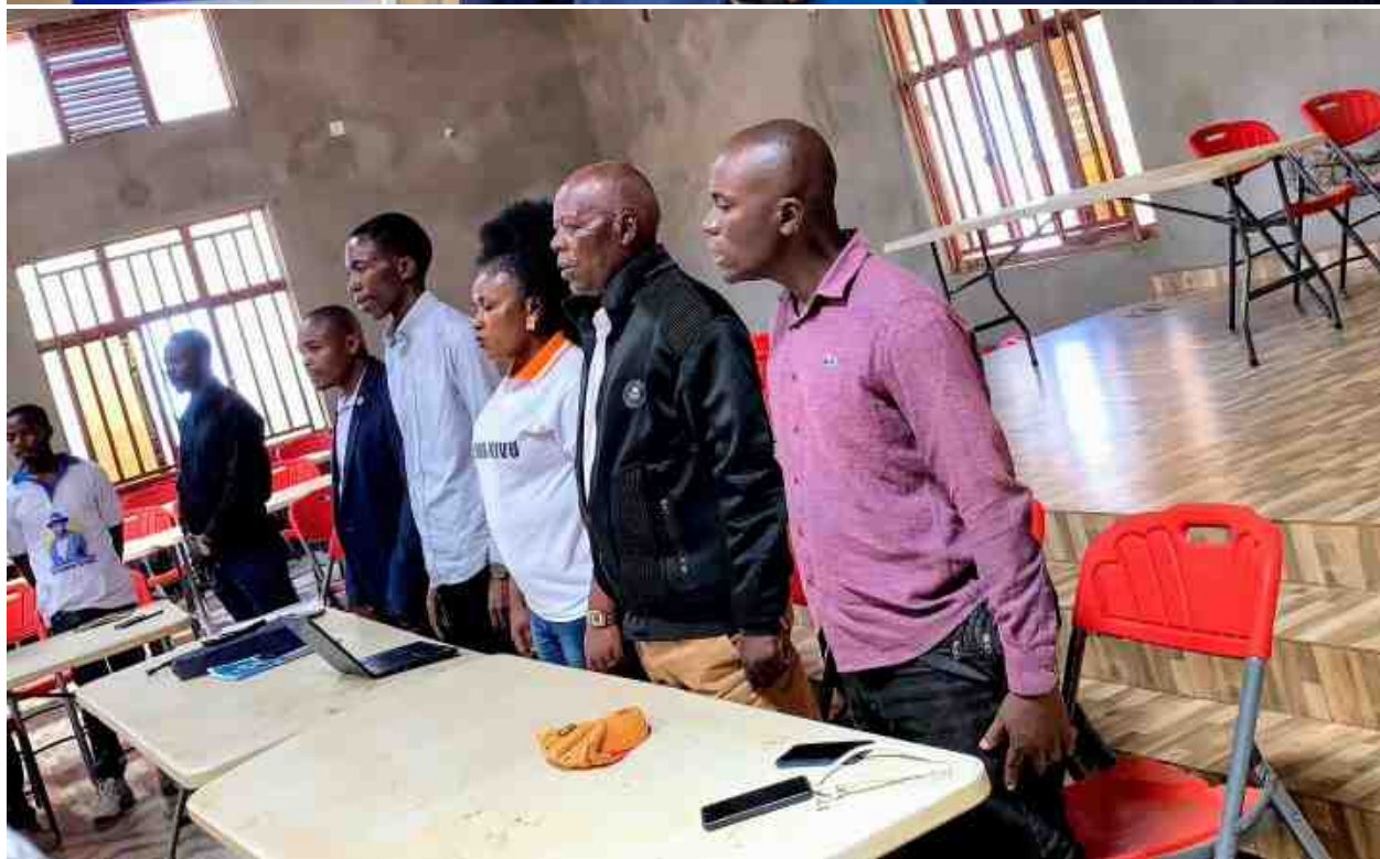
Photos pour la conférence de sensibilisation de KABARE