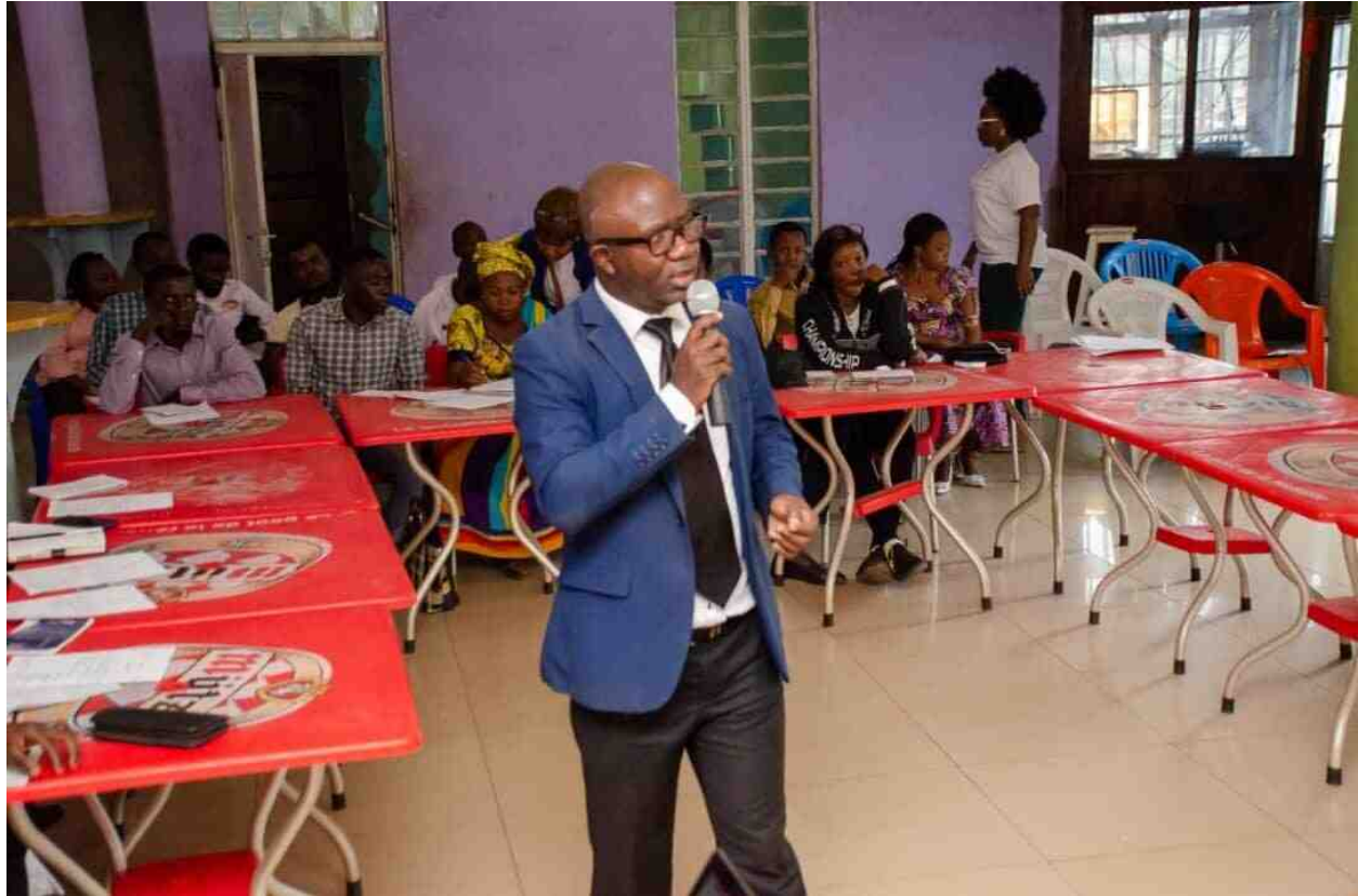
Photos de la visite des entrepreneurs