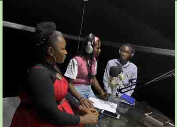
STUDIO DE LA RTNK