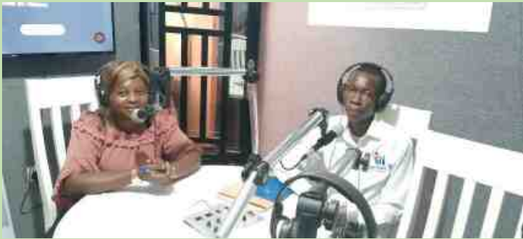
STUDIO DE LA MAMAN RADIO

Pour divulguer l'information à toute les couches de la population ciblées par le projet, les émissions radio sont organisées hebdomadairement. La Radio Télévision Ngoma ya Kivu c'est le mercredi de 16h30 à 17h 00 et la MAMAN RADIO le lundi de 12h30 à 13h15. Les thèmes abordés couvrent la matière portant sur l'entrepreneuriat et l'éducation financière au delà des sensibilisations en masses.