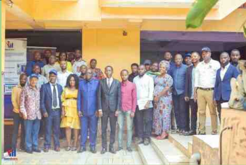
Photo de famille le jour du lancement officiel dans la salle de réunion « MAMAN KINDJA »